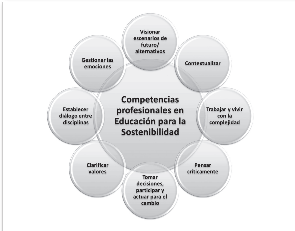
Fig. 1. Competencias profesionales en Educación para la Sostenibilidad